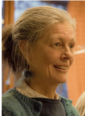
Marion Commerce Médiatrice « Droits du patient »